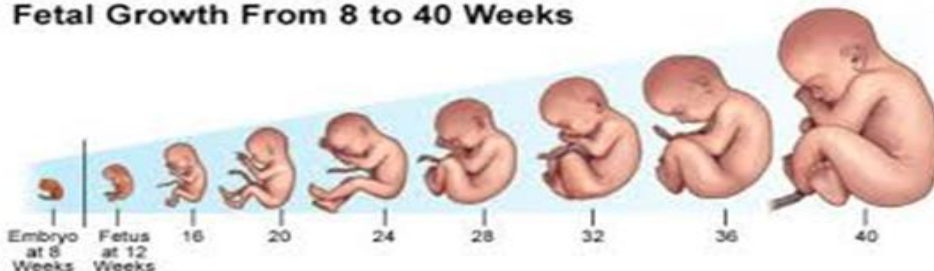
Fetal Growth From 8 to 40 Weeks

Постељица -заједнички орган мајке и плода и има улогу да обавља размену супстанци